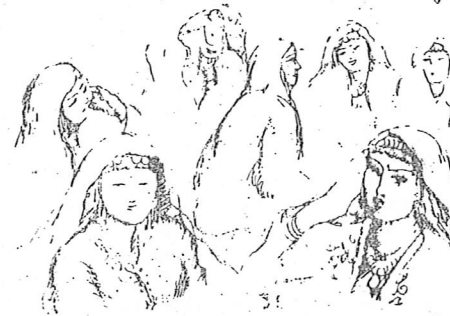
Bayramlarda kır eğlenceleri yapılırdı

şından aşağı düşen taneleri etraftaki çocuklar kapışırlar. Çocuğun tepesi üzerinde kalan buğday taneleri alınır. Bunlar bir dişi vücuda getirilerek çocuğun başına takılır. Buğday dizisi kopup dökülünceye kadar başında bırakılır. Arkasından hali vakti yerinde olanlar yemek verirler.