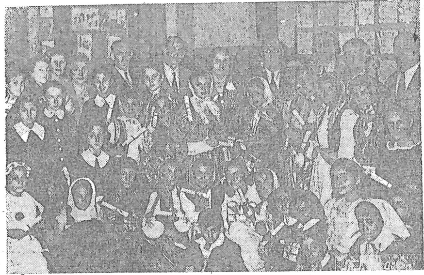
Mahmutpaşa I. İlkokulunda 28/Haziran/952 gününde 951 - 952 yılı mezun- larına törenle diplomaları verilmiştir. Bu arada Millî Elbiselerini giyen öğrenciler velilerine Millî Danslarımızdan örnekler sunmuşlardır. Resmimiz törenden sonra öğretmen, öğrenci ve velileri bir arada göstermektedir.

Biz uçaklar ikinci dünya harbinin uçakları Yağmura girdik, buluta girdik Bulutlardan yağmur yağar, kar yağar Yağmur değil, kar değil, biz ölüm getirdik Suda zehir, toprakta zehir, ateşte zehir Zehirlendi dünyamız zehirlendiler Yıldızlar bıçaklandı Yine çığlık, çığlık alarm düdükleri Dolandı saçlarına rüzgârın Davul davul köpürdü bombardıman