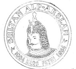
Alp - Arslan'ın Rozetlerde kullanılan minyatürden alınan resmi.

Ardahan - Türkmenların kız ve kadınları, "KIRK - ÖRÜK SAÇ" larını, zincir, boncuk ve ipekli saçbağı ile süsleyip; boyunlarına da iri iri boncuklar takarlar. Kadınların başlarını, renkli veya kara ipekli "SARMA" denilen örtü ile erkek başı gibi sıkı bağlarlar.