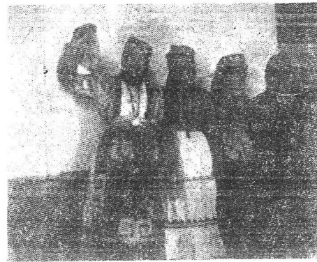
Kars - Yerli Genç Kadın Kılığı: Bar Oynayan Köylü Kızlar (1960 yılı).

Gövdede, açık (kızıl, al, ak) veya koyu (kars, kahve, kurşun) renkli İŞLİK, onun üzerine, omuz verleri, dirsekleri, cebi açık renkli ve kendisi kara, boz, mor renkli kuzu yünden GAZEKİ denilen çepken; belde gençlerin KEMER veya yünden BAĞ, yaşlıların gazeki altında KURSAK; bacaklarda arkası körüklü ve dar paçalı ZİĞVA denilen salvar; ayaklarda her renkten veya işlemeli DİZLEME - ÇORAP; ÇARİK, YEMENİ veya MEST - KALOŞ. Bütün Ahıska, Artvin ve Çoruk boyu da, Kıpçaklar'dan kalma KÖRÜKLÜ - SALVAR/ZİĞVA giyinir. 93 (1878) Felâketinden sonra Ardahanlı ve Şavşatlı göçmenler Erzurum'a çokça gelince, oradaki yerli - dadaslar, Kars gibi KADI - Bİ-