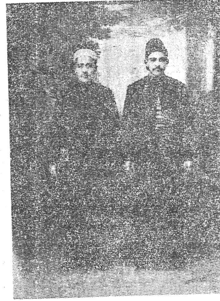
Resim: 1 Konya'da ilmiye giymi

Millî giyimlerimiz konusu üzerinde şimdiye kadar yapılan araştırmalar hem az, hem de tatmin edici değildir. Yabancı yayınlar arasında Türk millî giyimleri, rastgele derlenen birkaç resimle izah edilmiş, hatta bunun en acı örneği Paris'teki Musée de L'homme'da verilmiştir. Bu müzede her millete ait bariz etnografya malzemesi ve giyim örnekleri teşhir olunurken, Türkiye'ye ayrılan vitrinde, Türk millî giyimini yalnız bir çift çarık, keçe kepenek ve kıl heybe ile temsil edilmiş ve Hamdi Bey'in hazırladığı (Les costumes populaires de la Turquie en 1873) adlı eserinden birkaç fotoğraf seçilerek vitrine yerleştirilmiştir. Türk millî giyimini herhalde bu değildir ve tanınmış bir Avrupa müzesinde de Türk millî giyimini bu şekilde teşhir etmek hatadır.