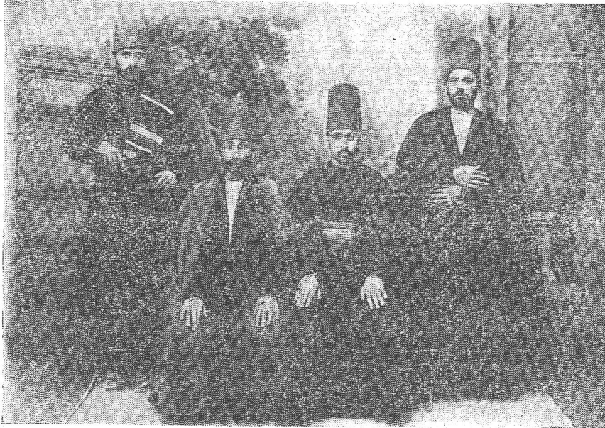
Resim: 3 Konya'da Mevlevi giyimleri.

6 — Tekke Giyimi: Herhangi bir tarikatın mensubu dervişlerin giyimidir. Konya'da mevlevilik hâkim olduğu cihetle, diğer tarikat mensuplarının giyim şekli üzerinde durmayacağız. Mevlevilerin giyim şekli ise mensuplarının mevki ve makamlarına göre şekil değiştirmiştir. Genel olarak başta sikke, sırtta da ayak topuklarına kadar inen geniş kollu cübbe ve cübbenin altında da ışık ve şalvar bulunurdu (Fazla bilgi için bak: Mevlevi giyimleri, Türk Etnografya Dergisi, Sayı: 1, 1936) (Resim: 3).