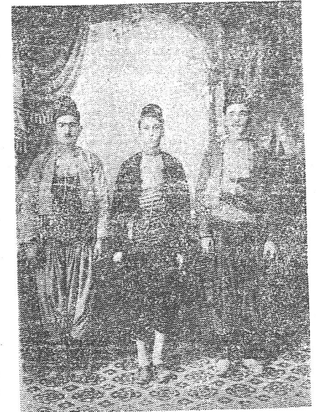
Resim: 2 Konya'da efe ve delikanlı giymi

Orta Anadolu'nun zengin bir medeniyet bölgesi olan Konya'da da mahalli giyimler, Anadolu'nun diğer bölgelerinden az-çok farklarla ayrılmıştır. Biz bu yazımızda elimizde bulunan XIX cu yüzyıl örneklerini gözönüne alarak, Konya'nın erkek giyimleri üzerinde kısaca duracağız: