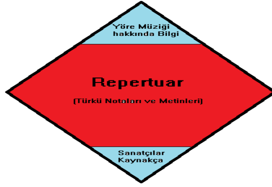
Salih Turhan'ın kitaplarının kurgusu

İcra ve yayın etkinliklerine bakılırsa Salih Turhan'ın kategorik olarak tamamen yaptığı/başardığı işler şöyle özetlenebilir: Sağda solda atıl duran türkülere - hem yorumcu hem de seçki yazarı olarak can vermek; Türkiye'de genel ve yöre türküleri hakkında en kapsamlı kitapları hazırlamak; (6) derlenmiş türküleri notalarla işlemek, vitrine çıkarmak ve bir küratör gibi türküleri sergiye çıkarıp ilgilenenlerin beğenisine sunmak. Her ne kadar kendisi 300 kadar türkü derlemişse de, bunların bir kısmı TRT kurumu repertuarında yer alırken, kalanını (derleme dışında çeşitli ses taşıyıcılarından hareketle dikte ile notaya aldığı ve TRT repertuarında bulunmayan yaklaşık 2500 türkü ile birlikte) ayrı bir kitap olarak değerlendirmemiş, diğer kitaplarına yedirmiştir. Metin ve melodi bağlamında kuramsal çerçeveye dayanan analitik çalışmalar yapmamıştır gerekçesiyle onu sadece bilimsel türkü (antropoloğu) araştırmacısı olarak görmeyebiliriz. Fakat eksiklik olarak görülen bu husus onun icra ve kitap yayın etkinliklerinde yok değildir. Çünkü tüm bu etkinlikler (yukarıda da değişik çalışmalarının betimlenmesinde gördüğümüz gibi) aslında tutarlı bir sistematığe dayanıyor ve bu sistematığı her defasında geliştirmeye çalışıyor. Bu anlamda onu ayrıca (= kendi kendini eğiten ve geliştiren anlamında) bir "autodidakt" türkü uzmanı olarak nitelemek mümkündür.